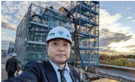
▲橋脚基礎5本のうち1本は完成し、残る4本の建設が急ピッチで進められていました。

千葉公園は「いつでも だれでも くつろげる "わたしの芝庭"」をコンセプトに、令和5年度から都市公園法のパークPFI制度を活用し、令和6年4月にリニューアルオープン。芝生広場(8,000㎡)や各種店舗、スケートボードを楽しめるパンプトラック等が整備され、来園者数は10万人以上増加しているとのことでした。