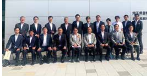
▲岩槻高齢者講習センターにて

大久保浄水場は、高度浄水処理施設の設計・建設が進められています。現在、本県の高度浄水処理施設の導入は新三郷浄水場のみとなっています。大久保浄水場の工事の進捗状況と、完成した際の効果について視察しました。《令和5年度予算額:103億3万9千円(総事業費:約616億円、事業期間:令和2年度~令和10年度)》