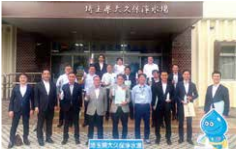
▲大久保浄水場にて

岩槻高齢者講習センター(令和6年5月27日開設)では、1日に最大300人の高齢ドライバーの方が講習と認知機能検査を受けられています。県民の利便性の向上について、運営状況を視察しました。《令和5年度予算額:57億5,688万8千円(総事業費:約64億円)》