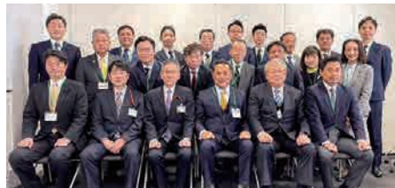
東武鉄道(株)本社にて

東武東上線利便性向上促進議連は2月26日、東武鉄道(株)への要望及び意見交換を行いました。ホームドアの設置や終電時間の延長など、利便性と安全性の向上を求め、要望書を提出しました。