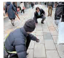
指が痛くなるほど寒い中で作業、皆さんお疲れ様でした。

「第三回 大正浪漫通り 蚤の市・クラフト市(主催:大正浪漫通り商店街振興会)」開催の前日2月23日は、その準備作業をしました。