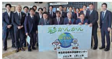
埼玉県環境科学国際センター 彩かんかんにて

午後は、3月1日リニューアルオープン直前の「彩の国さいたま芸術劇場」へ伺いました。全てのホールに趣があり、また、耐震補強や感染症対策が施され、重厚感のある施設でした。