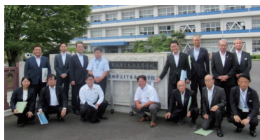
▲茨城県立IT未来高等学校正門前にて

続いて牛久シャトー。平成19年に「近代化産業遺産」に認定され、平成20年には国の重要文化財に指定、令和2年に「日本遺産」に認定されるなど、近年、その歴史的価値の高さが広く認められています。文化資源の保存・活用に係る取り組みを学びました。